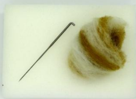
SPOTŘEBA OVČÍ VLNY 2 GRAMY