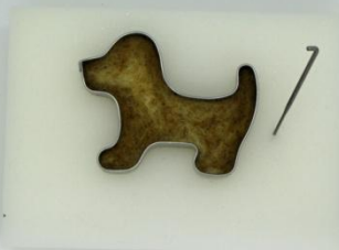
PO VYTAŽENÍ Z VYKRAJOVÁTKA JE VÝROBEK PEVNÝ A DRŽÍ TVAR