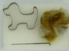
SPOTŘEBA DLE VELIKOSTI VYKRAJOVÁTKA