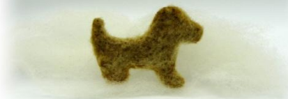
DOBA PLSTĚNÍ 5 - 15 MINUT