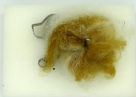
NEJDŘÍVE VLNU ROVNOMĚRNĚ ROZESTŘEME