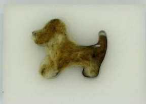
JEHLU VPICHUJEME SVISLE, ŠPIČKA ZAJÍŽDÍ AŽ DO MOLITANOVÉ PODLOŽKY