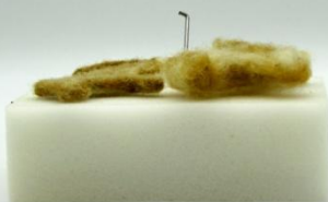
TLOUŠŤKA NA KONCI A NA ZAČÁTKU PLSTĚNÍ