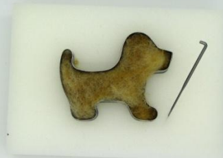
ČASTO MĚNÍME STRANY, OTÁČÍME VYKRAJOVÁTKO I S VLNOU